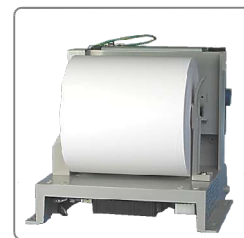
Interface : double